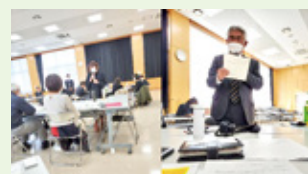
【説明後の質疑の様子】

結果、令和5年度では、「各地区で1回以上の開催を目標とする」との意見交換となりました。