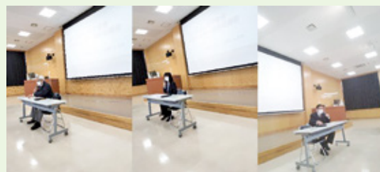
【それぞれのセンターごとの説明】

内 容：令和4年度の活動実績のふりかえりと、令和5年度の活動計画(目標と課題など)の紹介、現在抱えている課題や今後取り組みたい構想などについての意見交換がなされました。