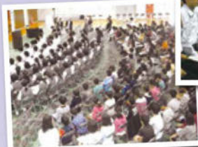
▲財光寺小5・6年生も参加。