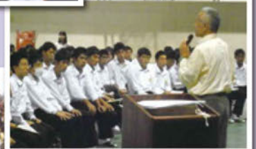
「これからをどう生きていくのか」を語るフォーラム