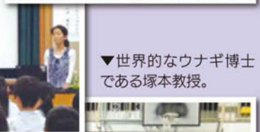
▼世界的なウナギ博士である塚本教授。