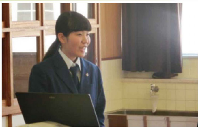
高校生の言葉には親しみと夢があった