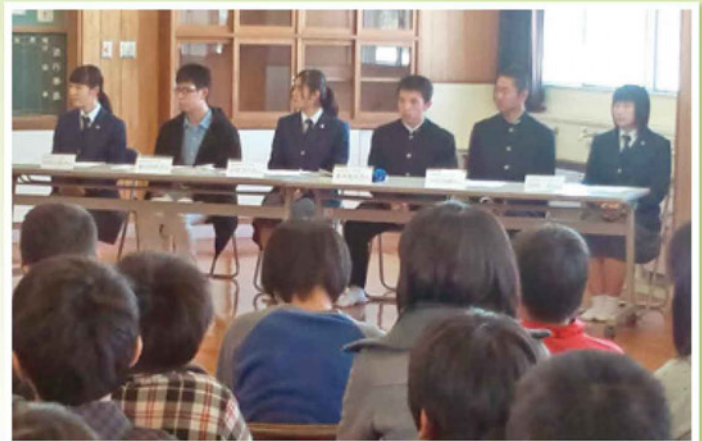
アドバイスをくれた高校生の皆さん